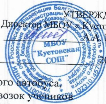
Схема движения школьного автобуса, предназначенного для перевозок учеников по маршруту «Кустовое-Калинино»