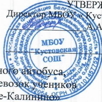
Схема движения школьного автобуса предназначенного для перевозок учеников по маршруту «Кустовое-Калинино»