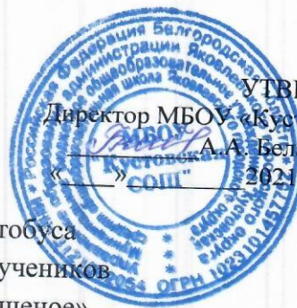
Схема движения школьного автобуса предназначенного для перевозок учеников по маршруту «с. Кустовое-с. Мощеное»